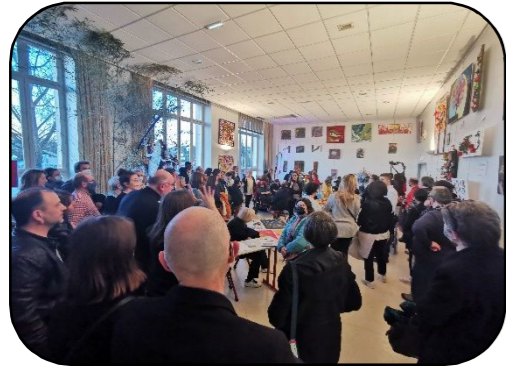
Vernissage de l'exposition du festival Handiclap

Du 14 mars au 25 mars 2022, la MHT a eu le plaisir d'accueillir l'exposition d'arts plastiques du festival Handiclap .