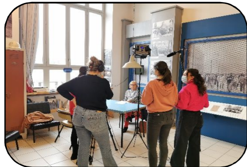
Etudiantes en train d'interviewer une ancienne travailleuse syndicaliste des chantiers navals

Depuis novembre 2021, la MHT a eu le plaisir de travailler avec des étudiantes et étudiants de la licence professionnelle des métiers du numérique TIC ARC de l'IUT de La Roche sur Yon pour la réalisation de plusieurs courts-métrages.