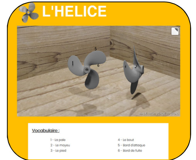
Aperçu de la modélisation d'hélices en 3D dans l'exposition numérique

Cette exposition numérique sera mise en ligne sur notre site Internet très prochainement.