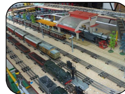
Circuits miniatures réalisés par le Cercle Atlantique du Zéro

Depuis plusieurs années, la MHT accueille régulièrement l'association Cercle Atlantique du zéro et leurs circuits ferroviaires au format zéro !