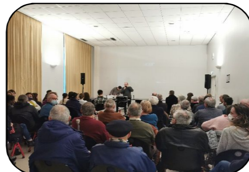
Restitution du travail des étudiant.e.s le mardi 8 mars

Les six documentaires proposés ont été accueillis avec intérêt et enthousiasme par le public. Vous pourrez très prochainement les retrouver à la Maison des Hommes et des Techniques.