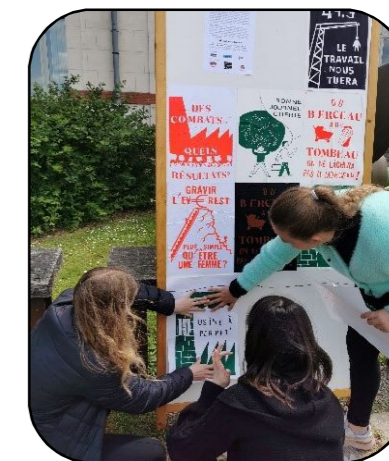
Elèves collant leurs affiches @MHT

https://www.maison-hommes-techniques.fr/valorisation-des-travaux-deleves/