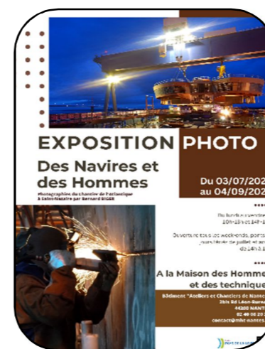
Affiche de l'exposition « Des Navires et des Hommes » @MHT

Du 8 juillet au 4 septembre 2023, la MHT aura le plaisir d'accueillir l'exposition Des navires et des Hommes du Conseil Régional des Pays de la Loire et réalisée à partir de photographies de Bernard BIGER.