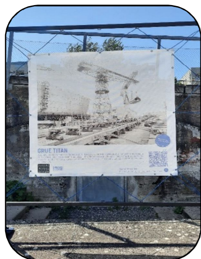
Panneau de l'exposition extérieure « Chantiers Navals, Balade visuelle et sonore »

Pour sa 3 e édition, la MHT a eu le plaisir de participer au grand évènement nautique et artistique Débord de Loire qui s'est tenu du 30 mai au 5 juin dernier.