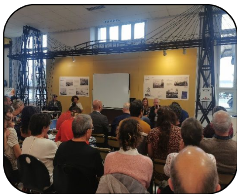
Conférence de la Grande Remontée

A l'initiative des associations Voiles de Loire et La Rabouilleuse , 25 bateaux ont navigué de Nantes à Orléans. Ils sont partis le 1er septembre de Nantes pour rejoindre le Festival de Loire à Orléans (20 au 24 septembre).