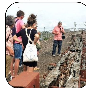
Visite du site des anciens chantiers navals

les cartophiles du pays nantais Allez Nantes! sur le sport dans l'agglomération. Vous avez aussi participé aux visites guidées du site des anciens chantiers navals animées par des bénévoles, et nos pôles d'information en extérieur ont rencontré un franc succès. Merci à vous !