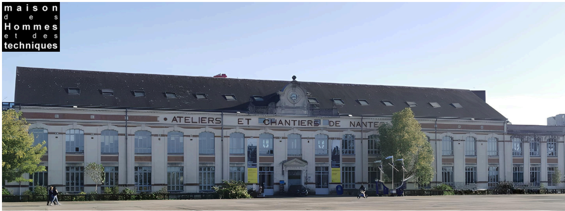
Maison des Hommes et des techniques